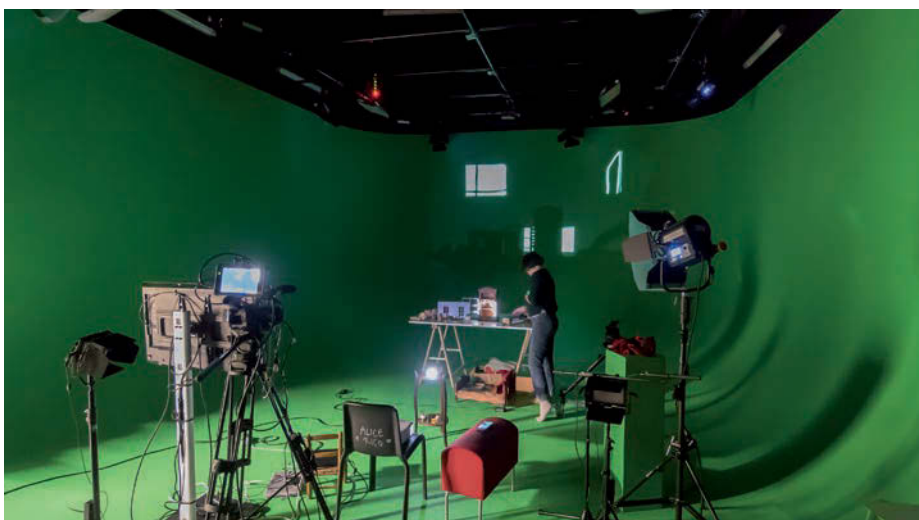
Atelier de sérigraphie et lithographie. Plateau Cyclo.