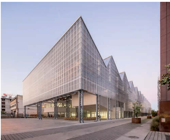
à gauche: Beaux-Arts Nantes Saint-Nazaire. Architecture Franklin Azzi. Photo Luc Boegly. à droite: Vues des ateliers. Photo Mai Tran