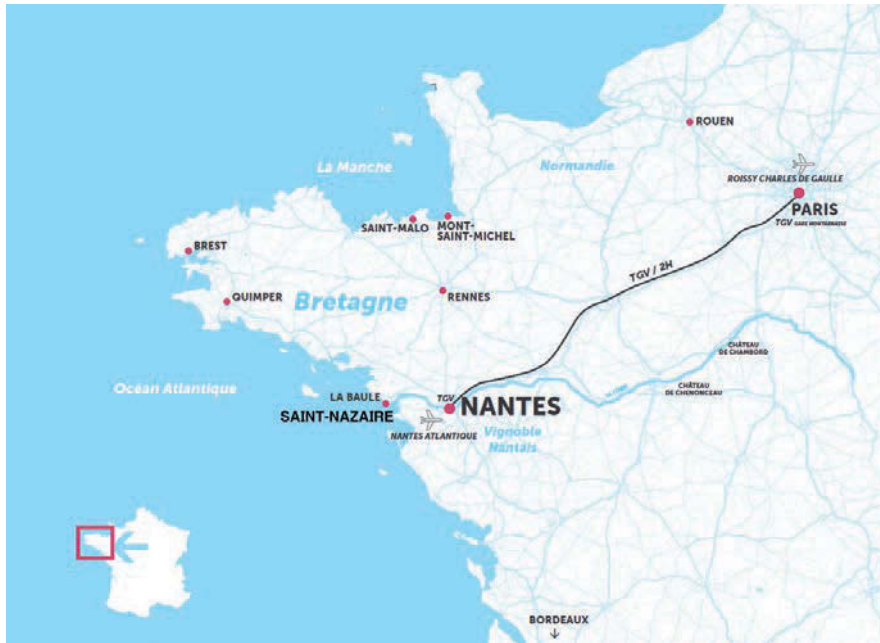
Anima Productions / Le Voyage à Nantes

Créée en 1904, l'école des beaux-arts Nantes Saint-Nazaire est au cœur d'un territoire culturel et artistique très actif en France à seulement deux heures en train de Paris : avec un grand Musée d'arts, Le Voyage à Nantes, le lieu unique, le Frac des Pays de la Loire, le Grand T, Le Grand Café et le LiFE à Saint-Nazaire... Essentiels pour préparer les étudiants en art à devenir les artistes de demain.