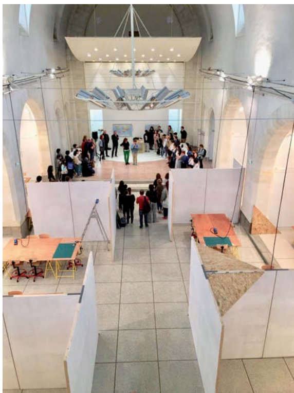
Rentrée des Ateliers de l'Estuaire 2019. Chapelle des Franciscains, Saint-Nazaire.