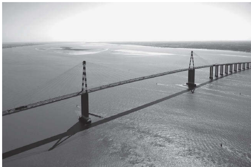
Pont de Saint-Nazaire